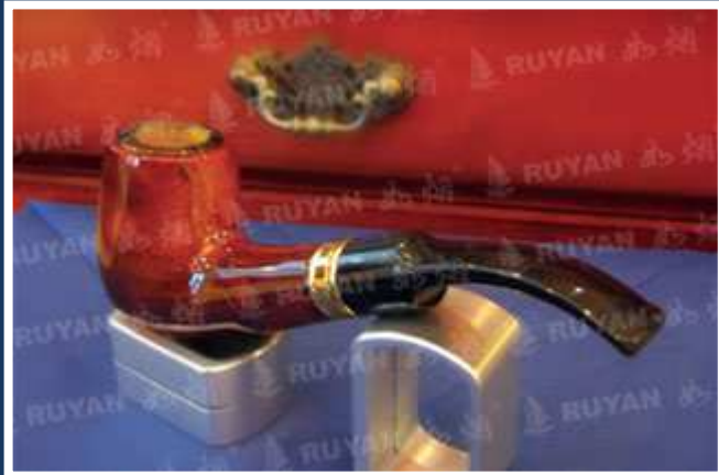
Illustration of use